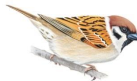
Vrabie de câmp