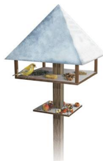
Hrănitore tip casuță